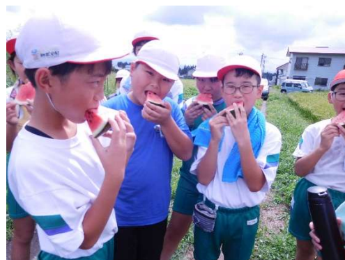
【おいしさを堪能する子ども達】