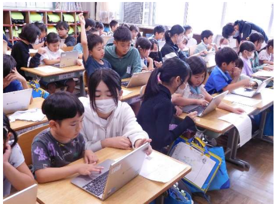
【1年生のタブレット操作をサポートする6年生】

なお、家庭におけるタブレットの使用にあたっては、別紙「学習用タブレットを使うときのやくそく<<小学生用>>」(配付済み)を確認するとともに、「滝沢小～スマホ・ゲームの心得」と同様に、家庭でタブレットを使う際のルールづくりもお願いいたします。