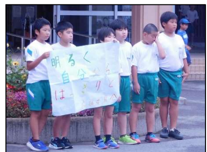
【2学期最初のJUあいさつ運動】